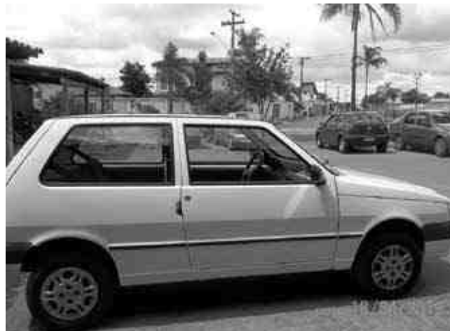
Já temos um carrinho com o DUT no nome do RK