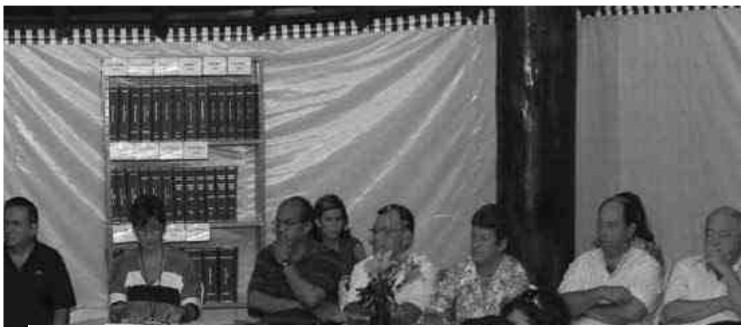
Conselho Consultivo observou atentamente a exposição da síndica, aprovando os encaminhamentos

Outra ação realizada pela Administração foram as inúmeras reuniões e visitas a Órgãos públicos em bus-